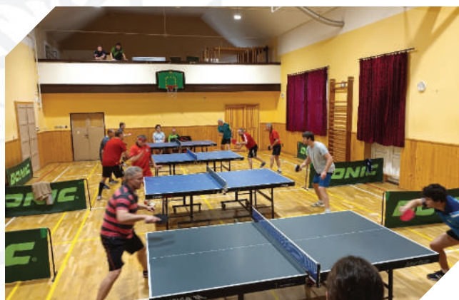
Vánoční turnaj 27. 12. 2022