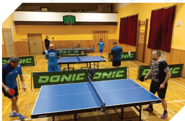
Mistrovské utkání Sportklub Štarnov „C“ – Křelov 21. 3. 2023