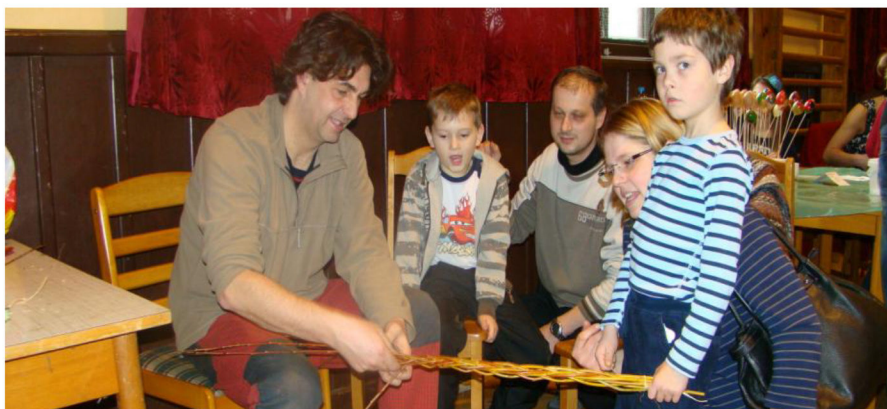
Velikonoční dílnička 2013