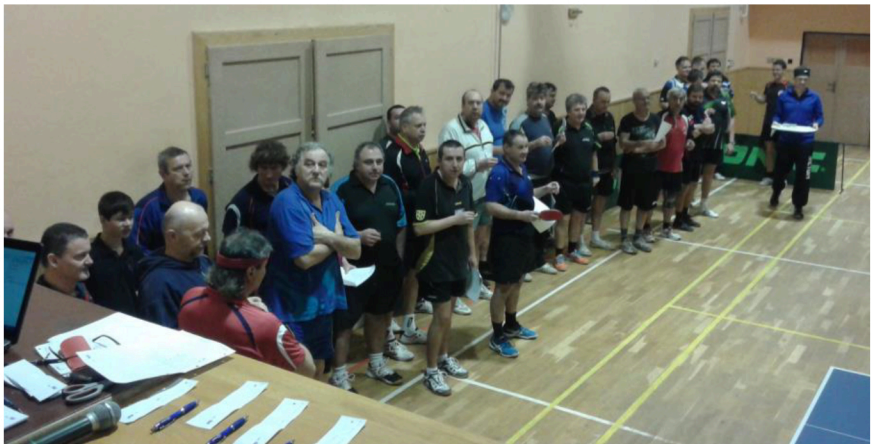
Slavnostní zahájení vánočního turnaje dne 29.12.2015