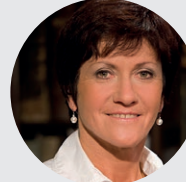
Květa Pecková Trojnásobná olympijská medailistka