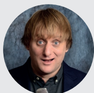
Lukáš Pavlásek herec a komik