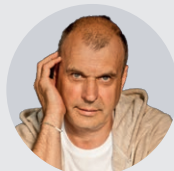
Petr Rychlý herec, moderátor, režisér