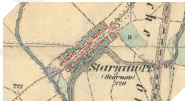
III. vojenské mapování, 70. léta 19. století