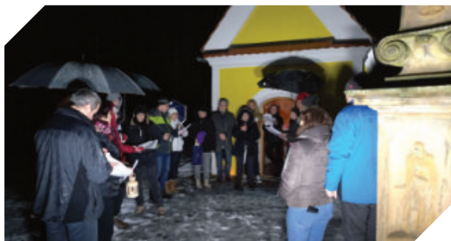
Štědrovečerní zpívání koled u kapličky